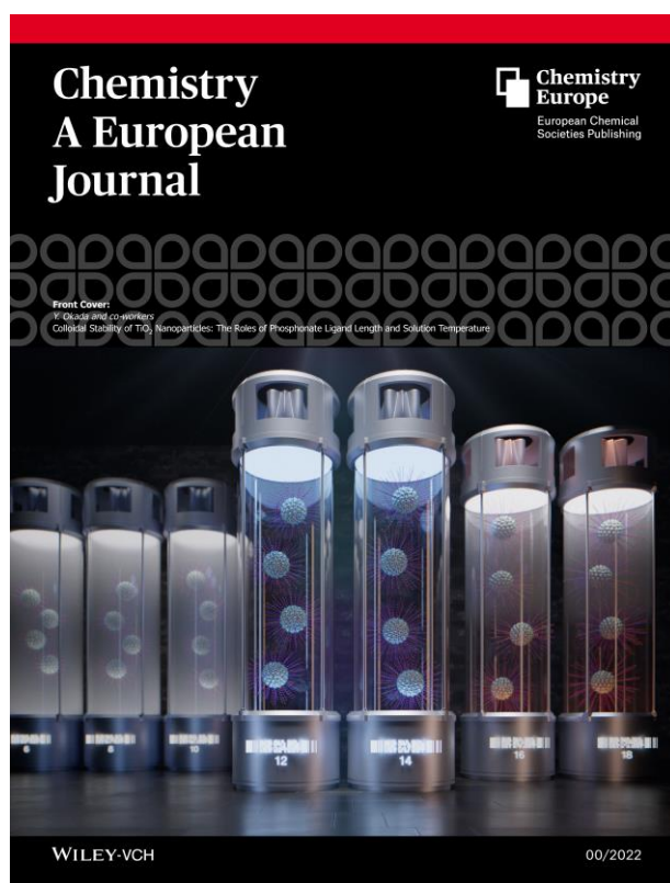
図 4 Chemistry - A European Journal 誌の Cover Picture

今後の展開 ：今回の成果は、今後の分散剤設計指針ならびに非水系溶媒中での分散凝集理論の体系化に向けた基礎知見として、ナノ粒子応用のさらなる発展に貢献できるものです。