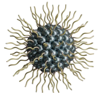
図1 分散剤被覆粒子のイメージ

近年、ナノ粒子表面において鎖状の分散剤がどのような構造をとっているか、という点が注目されています。図1のように、粒子表面に毛が生えたような絵をイメージするのが一般的ですが、実際にはこのような単純・均質な構造体ではなく、より複雑な構造（注3）であるという説が有力視されています。このような中で、鎖の構造がナノ粒子の分散性（注4）にどのような影響を及ぼしているかについての研究は、重要でありながら発展途上にあると言えます。